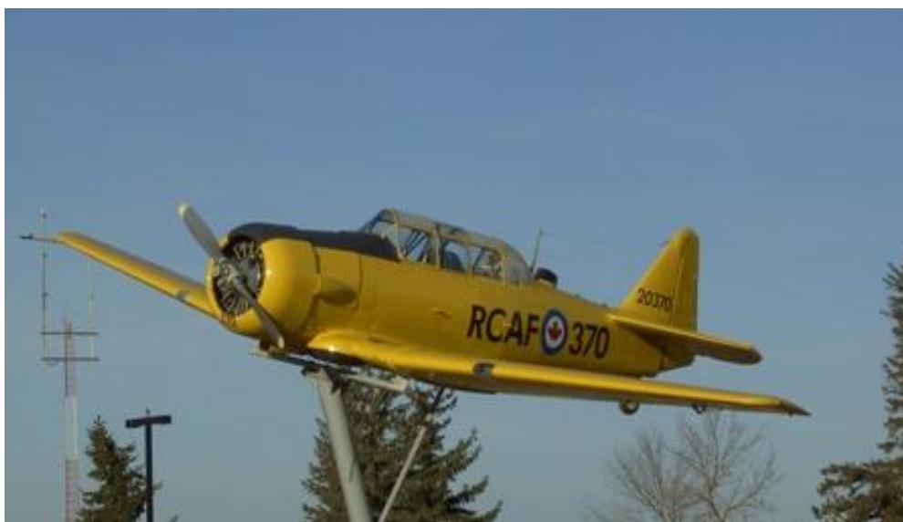
Harvard à l'aéroport. Exemple d'une levée de fonds de l'Escadrille COPA 92 Red Deer, AB

D'autres activités peuvent inclure la tenue de rendez-vous aériens, de repas, de séminaires et autres évènements qui sont de nature éducationnelle ou sociale.