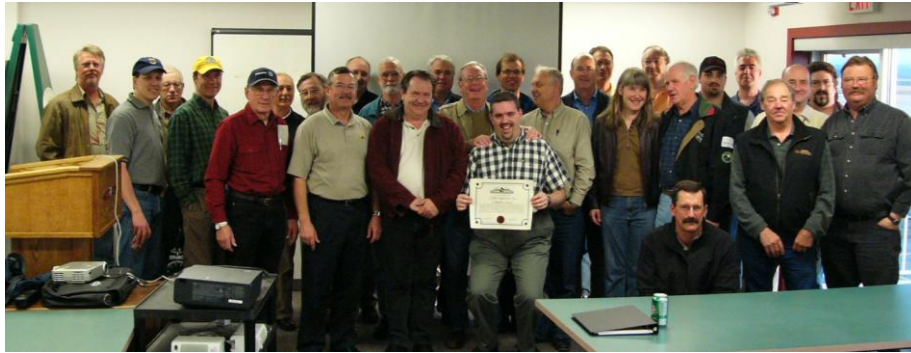
Escadrille COPA 14 – Calgary, AB